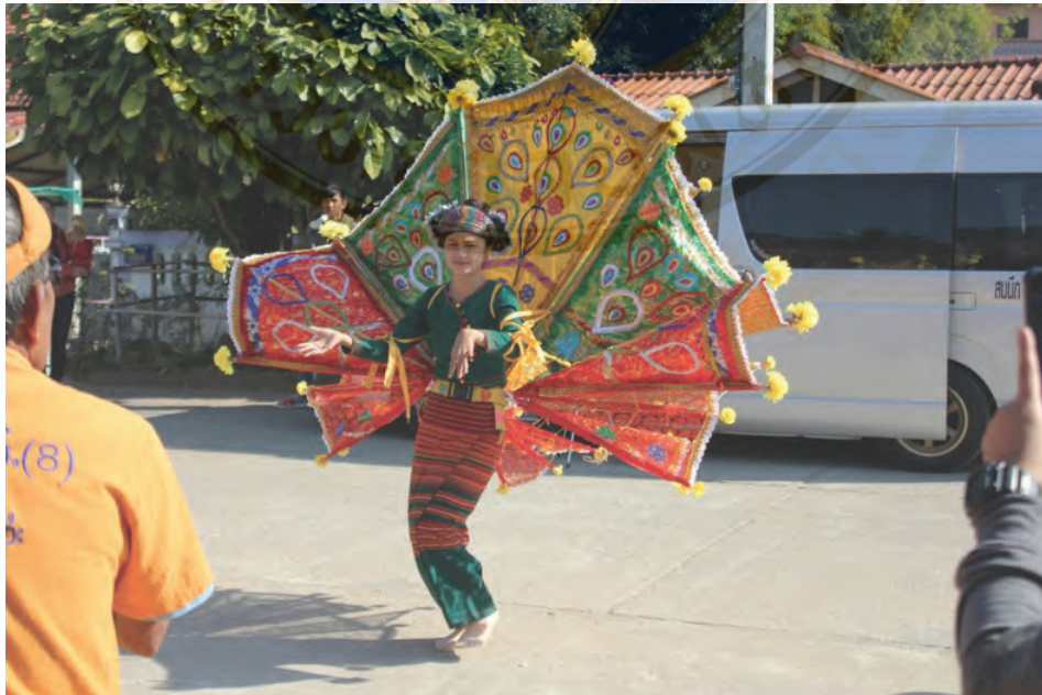
ภาพที่ 15 ลักษณะการรำรำกินนารี