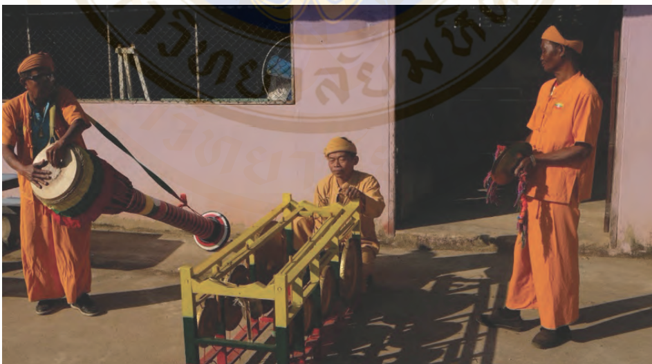
ภาพที่ 10 วงกลองยาวชาวไทยใหญ่

ขั้นตอนการบรรเลง 1. เครื่องเคาะทองเหลือง ให้จังหวะตกเริ่มต้น 2. ตามด้วยฉาบ 3. ตบด้วยกลองตอบรับ 4. เมื่อจบไม่มีลูกจบตายตัว แล้วแต่คนใดคนหนึ่งจะให้สัญญาณจบ