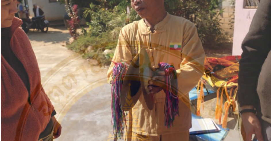
ภาพที่ 9 ฉาบ

ฉาบของชาวไทยใหญ่มีลักษณะการซึงด้วยเชือกตรงกลางฉาบสำหรับจับ และมีฟู่ตรงปลายเพื่อกันมือหลุดออกจากที่จับ การตีของฉาบ สามารถตีทั้งใบและขอบฉาบได้ในการบรรเลง