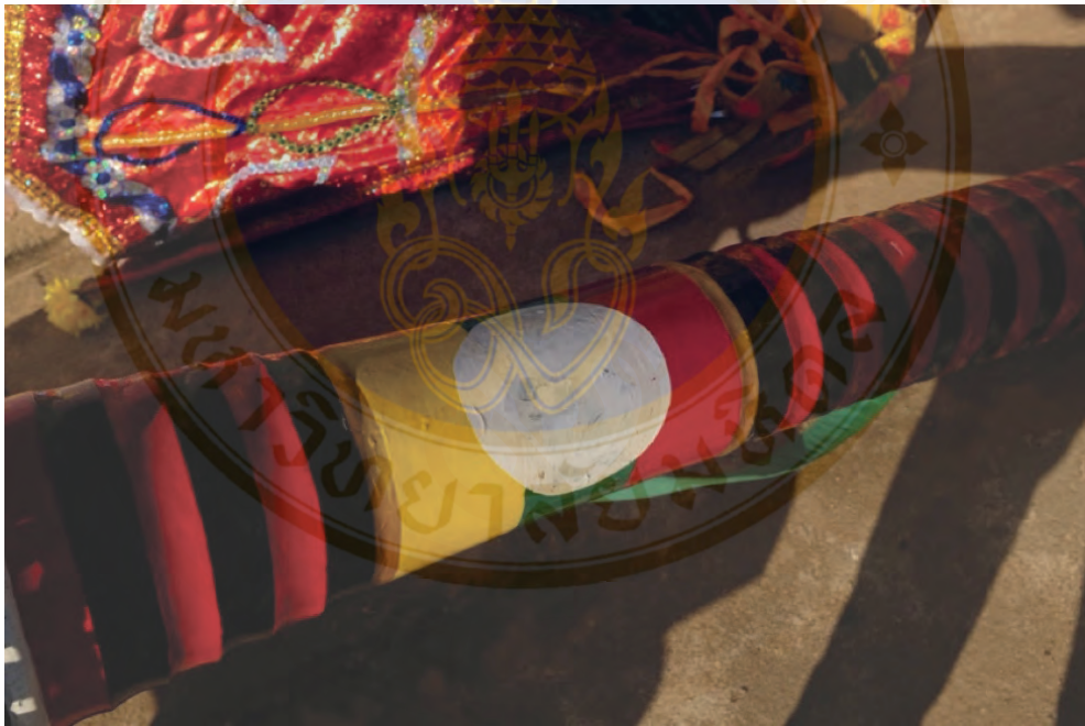
ภาพที่ 3 ตัวกลองใช้สีเป็นสัญลักษณ์ธงชาติของชาวไทยใหญ่