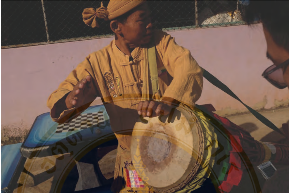
ภาพที่ 5 ทดสอบเสียงหน้ากลอง