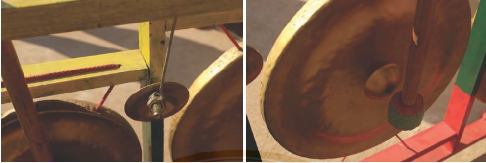
ภาพที่ 7 ตัวฆ้องใช้ไม้ และตัวฉิ่งใช้เหล็กตี

ฆ้อง (มอญ) มีส่วนประกอบดังนี้ ซ้าย 3 ไม้ เหล็กตีฉิ่ง 1 ไม้ ขวา 4 ไม้ โดยเสียงได้ดังนี้ ขวา คือ โน้ตโด 4 ลูก ซ้าย คือ โน้ตซอล 3 ลูก เรียงคู่ 8 ตามแผนภูมิรูปภาพ