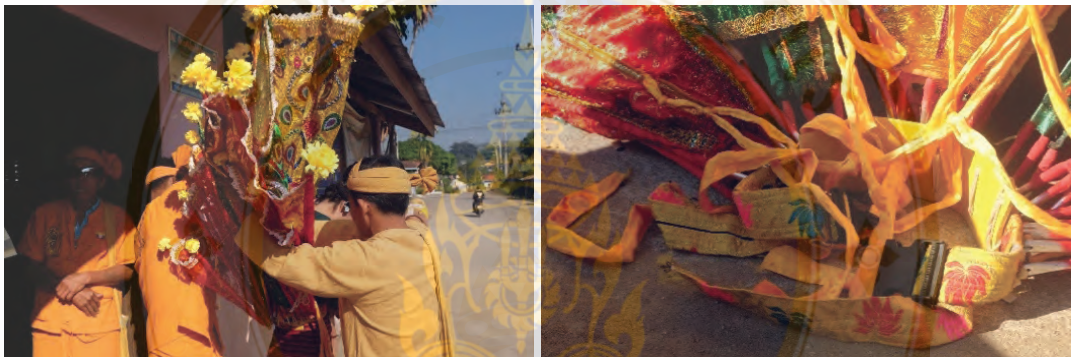
ภาพที่ 14 เข็มขัดรัดพุง และการสวมใส่ชุด