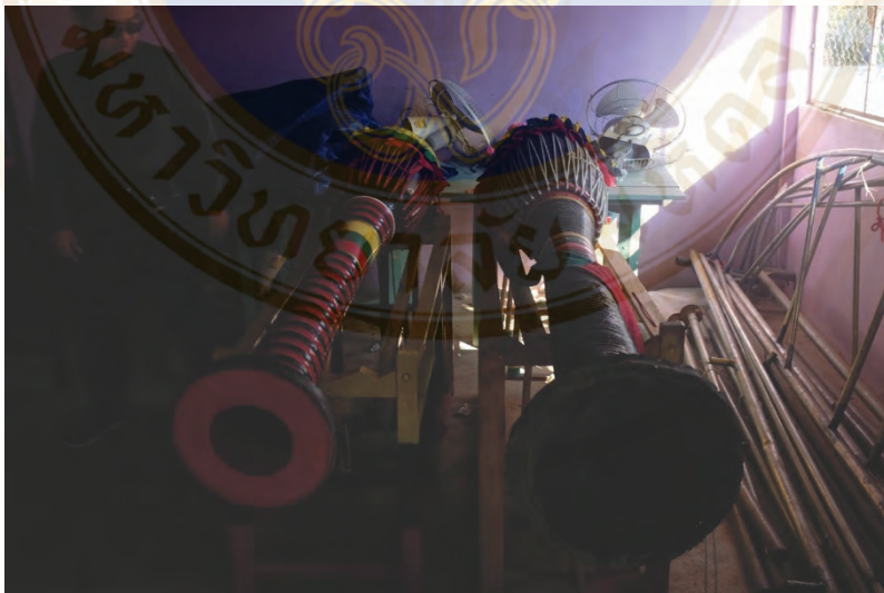
ภาพที่ 1 กลองยาว

กลองก็จะเอาไม้เป็นลำเดียวต้นเดียว ใช้ไม้เซาะ คล้าย ๆ กับไม้สัก เนื้อเบา และประสานกัน โดยนำมาแกะด้านใน ซึ่งในยุคหลัง ๆ ไม่มีการตัดไม้ทำลายป่าแล้ว แต่จะสร้างเครื่องดนตรีโดยการสาน ใช้ไม้ไผ่สานเป็นรูปร่าง และนำผ้ามาติด