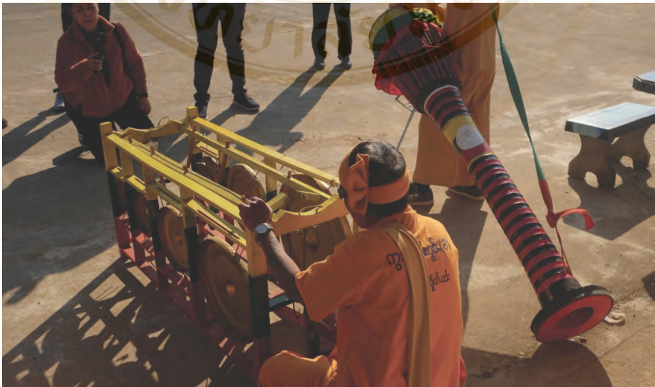
ภาพที่ 6 ฆ้อง (มองเซ็ง)

ฆ้อง หรือชาวไทยใหญ่เรียกว่า มองเซ็ง ทำขึ้นมาโดยการทำให้เป็นรูปร่าง ชาวไทยใหญ่เรียกว่า นมมอง แชนมอง มองเซ็ง แสดงถึงความสามัคคี ซึ่งในสมัยก่อนตีทั้งเจ็ดคน เพื่อแสดงความสามัคคี แต่ในปัจจุบัน ประยุกต์ขึ้นมาใหม่ ให้ฆ้อง 7 ลูกอยู่ในหนึ่งเครื่อง ใช้คนบรรเลงแค่คนเดียว เพื่อความง่ายต่อการบรรเลง วิธีการบรรเลง คือ ให้คนที่บรรเลงนั่งอยู่ด้านหลัง ใช้มือขวาจับคันทโยก ยกขึ้นลงเพื่อให้ไม้กระทบกับฆ้องทั้ง 2 ฝั่ง