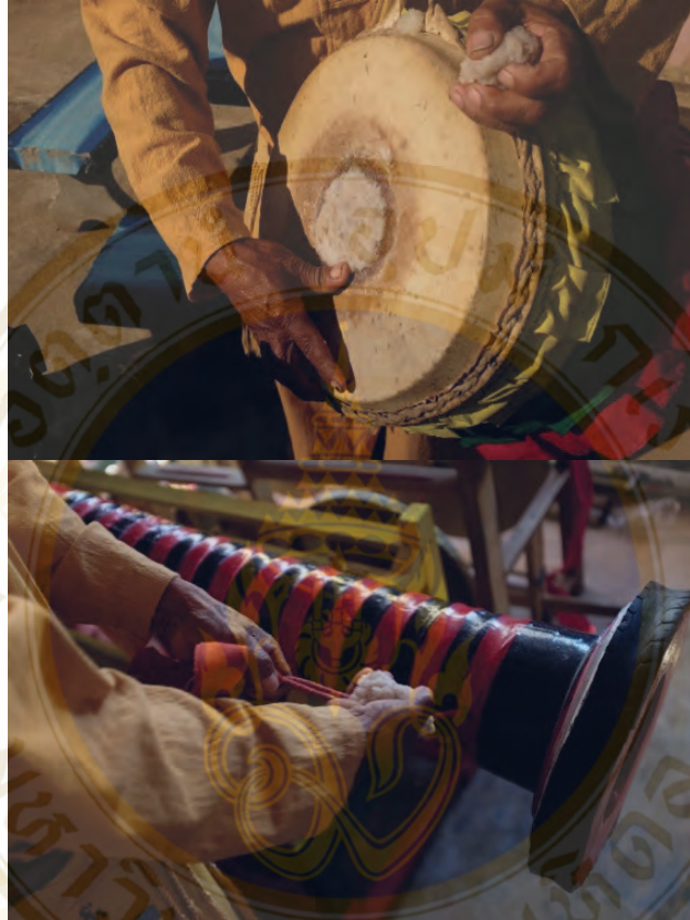
ภาพที่ 4 ข้าวเหนียวถูกับสายกลอง และตัดหน้ากลอง

วิธีปรับเสียงหน้ากลอง ก่อนเริ่มใช้ข้าวเหนียวถูกับสายกลองเพื่อเพิ่มความเหนียว ตัดที่หน้ากลองจนเต็มจุดดำ