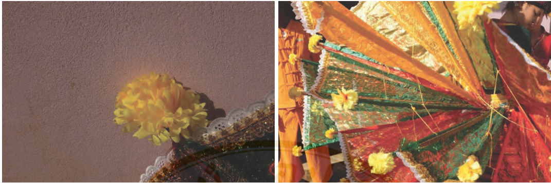
ภาพที่ 13 ชุดนกกินนารี ด้านปลายตกแต่งด้วยดอกไม้สีเหลือง