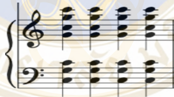
ภาพที่ 12 แบ่งโน้ตการบรรเลงวงกลองยาวไทยใหญ่ (ถอดโน้ต: กฤตวิทย์ ภูมิถาวร)

2.3 จังหวะฆ้อง เป็นจังหวะหลักในการบรรเลง ซึ่งจะเห็นได้จาก Full Score ว่าเริ่มต้นบรรเลงด้วยฆ้อง ในจังหวะหนักและมีความคงที่ โดยมี 1 ลักษณะ ดังนี้