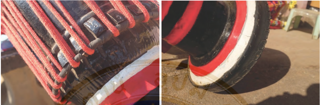
ภาพที่ 2 หน้ากลองซึ่งด้วยเชือก และลำโพงกลองติดด้วยยางล้อรถ